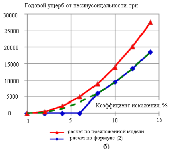
Рис. 1. Сопоставление электромагнитной составляющей ущерба, обусловленного несимметрией питающего напряжения